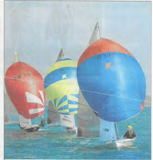
Première compétition de la saison ce week-end au lac d'Orient avec une régata interligues réservée aux « 505 »

Les retrouvailles en septembre seront placées sous le signe de la jeunesse avec les régates 505 national jeunes les 3 et 4, suivies le 10 par le challenge jeunes dériveurs et catamarans qui devrait mettre un point final à une saison qui s'annonce d'ores et déjà riche en rendez-vous.